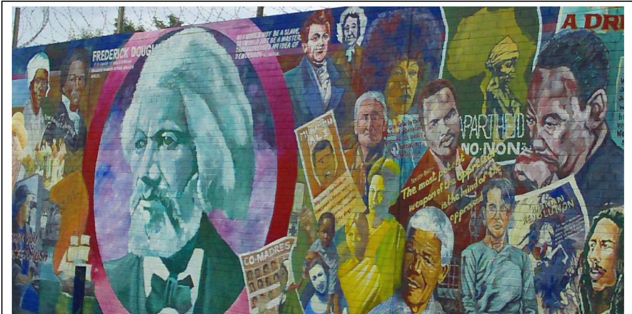
Wandgemälde/Murals in Belfast

Selbstverständlich kann auch auf eigene Faust auf (Kneipen)Tour gegangen werden.