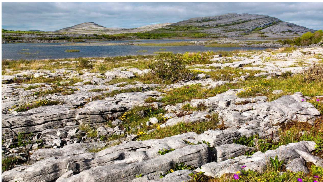
Region Burren im Westen Irlands