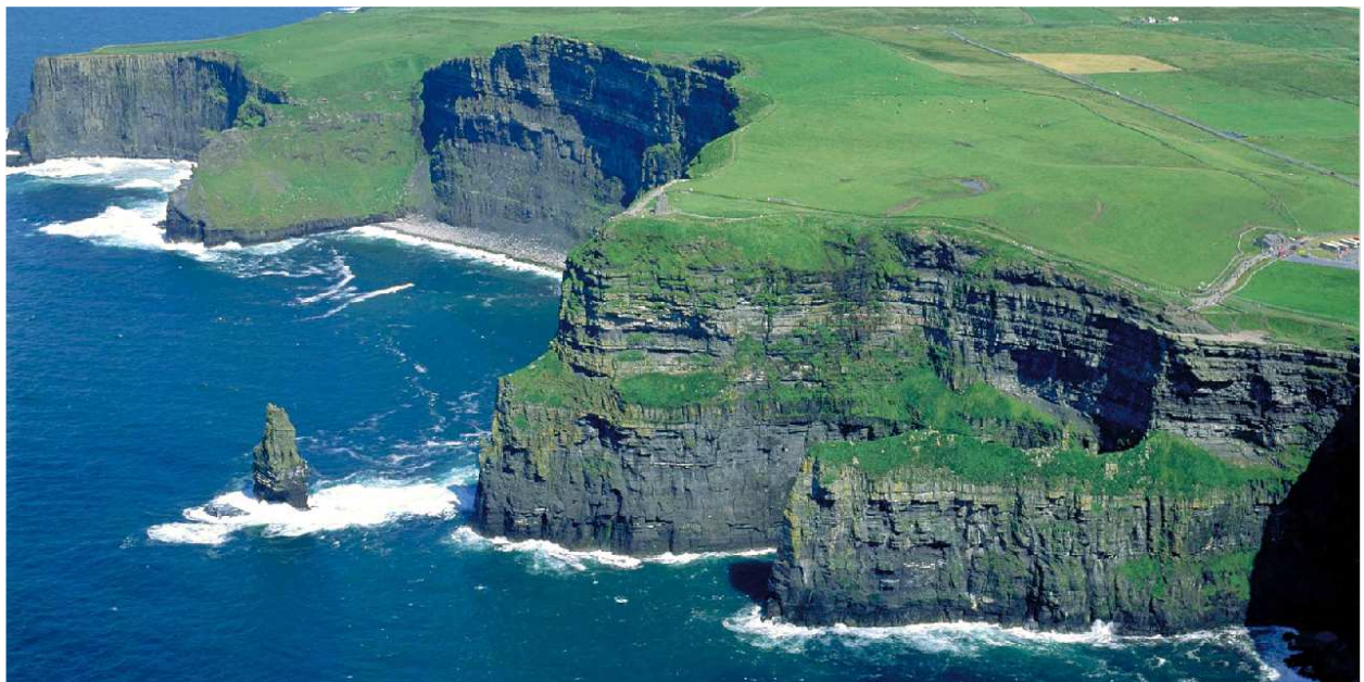
„Cliffs of Moher“, die berühmten Steilklippen der irischen Westküste