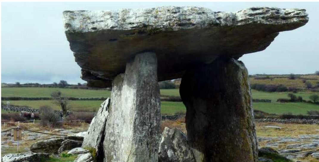
Portalgrab Poul nabrone Dolmen

Wir treffen uns mit Vertretern von Burren Beo, einer Non-Profit-Organisation, die sich für ökologisch und sozial verträglichen Tourismus in dieser bedrohten Karstlandschaft einsetzt. Im Burren finden sich viele mediterrane, alpine und sogar arktische Pflanzen und eine Vielzahl von Monumenten aus unterschiedlichen Epochen. Spätnachmittags Ankunft in Ballyvaughan, einem kleinen Ort an der Westküste im County Clare, wo wir zu Abend essen und übernachten.